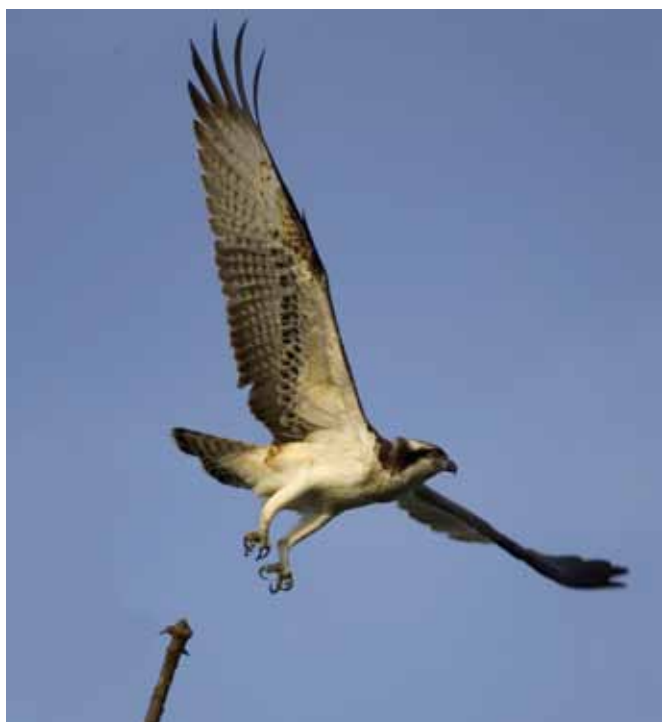
■ Balbuzard pêcheur ( Pandion haliaetus ), rapace dont la population nicheuse est "Vulnérable" en France

L'évaluation des menaces pesant sur les 277 espèces d'oiseaux nicheurs en métropole révèle une situation très préoccupante : 73 d'entre elles sont actuellement menacées sur le territoire, soit plus d'une espèce sur quatre. L'intensification des pratiques agricoles et la régression des prairies naturelles ont entraîné le déclin de nombreuses espèces. C'est le cas du Râle des genêts, marqué par une diminution de 50% de ses effectifs en 10 ans et classé "En danger", et de la Pie-grièche à poitrine rose, qui ne compte plus aujourd'hui que 30 à 40 couples en France et classée "En danger critique".