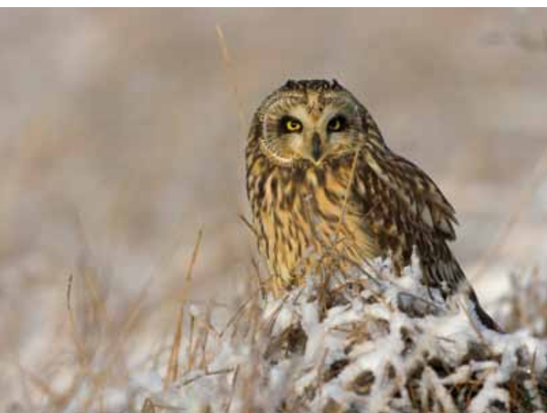
■ Hibou des marais ( Asio flammeus ), rapace nocturne nichant en métropole et classé "Vulnérable"

La Liste rouge nationale permet de mesurer le degré de menace pesant sur les 568 espèces d'oiseaux recensées sur le territoire métropolitain, pour chacun de leur statut de présence (nicheur, hivernant ou de passage).