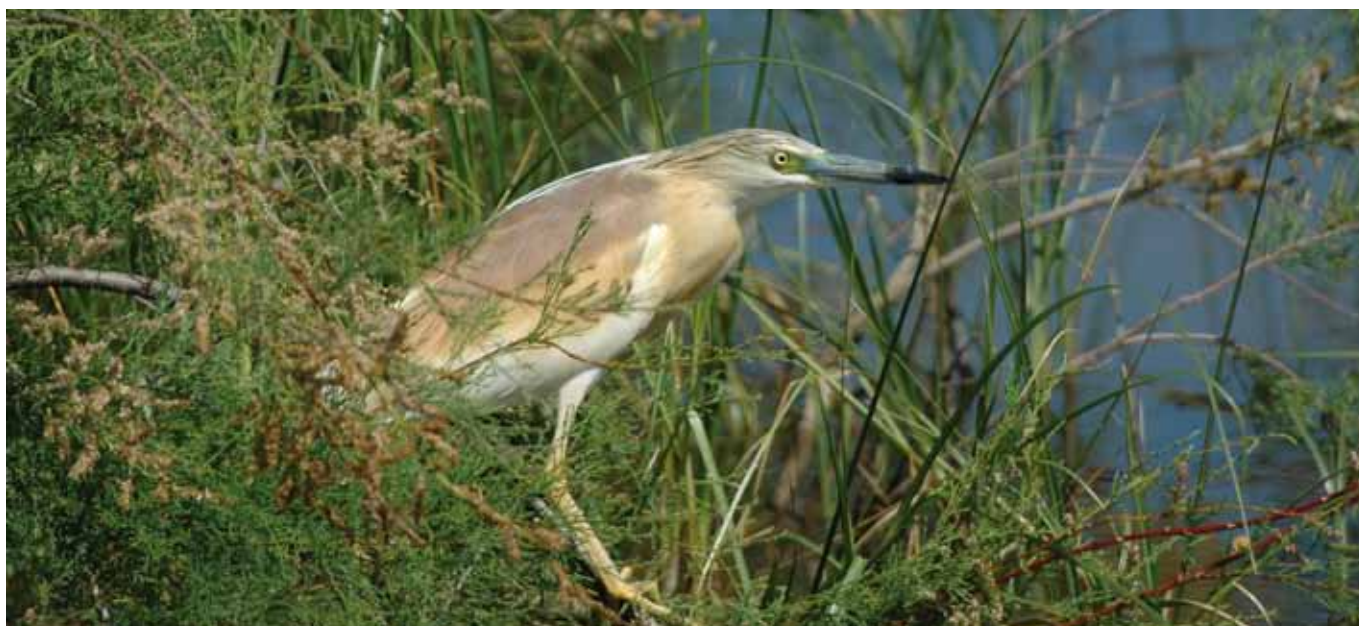
■ Crabier chevelu ( Ardeola ralloides ), espèce classée en catégorie "Quasi menacée" au niveau national