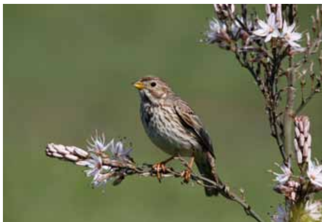
■ Bruant proyer ( Emberiza calandra ), passereau nicheur en métropole et classé "Quasi menacé"

En dépit de cette situation préoccupante, différents exemples montrent que les efforts de conservation peuvent porter leurs fruits. Les actions de protection des zones humides engagées depuis plus de deux décennies ont permis d'améliorer la situation de plusieurs espèces nicheuses, comme le Blongios nain et la Guifette moustac, et de quelques espèces hivernantes, comme le Bécasseau maubèche. Après avoir disparu de France