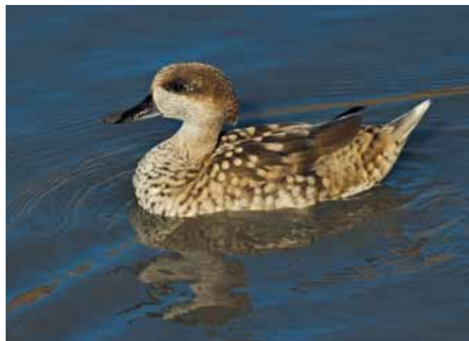
■ Sarcelle marbrée ( Marmaronetta angustirostris ), espèce disparue de métropole en tant que nicheur

Historiquement persécutés, certains rapaces comme le Milan royal restent aujourd'hui victimes de tirs au fusil et d'empoisonnements par des appâts toxiques, malgré leur protection réglementaire. L'Aigle de Bonelli est quant à lui menacé par la raréfaction de ses proies (Lapin de garenne et Perdrix rouge) et par son électrocution sur les lignes haute-tension. Le premier est classé "Vulnérable" et le second "En danger".