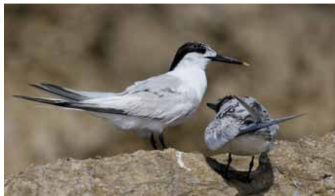
■ Sterne caugek ( Sterna sandvicensis ), oiseau marin nichant en métropole et classé "Vulnérable"