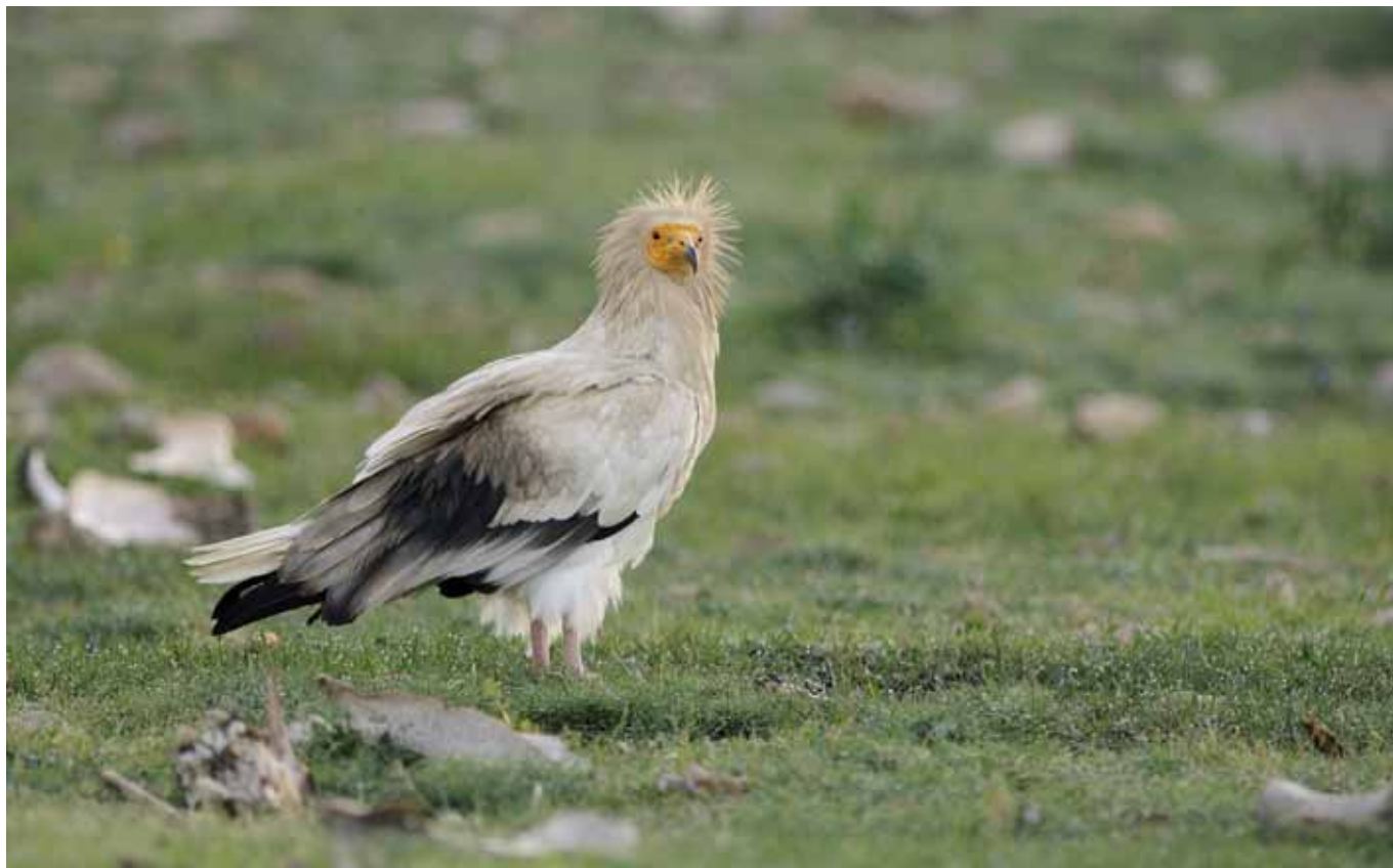
■ Vautour percnoptère ( Neophron percnopterus ), une espèce de vautour "En danger" en France et au niveau mondial