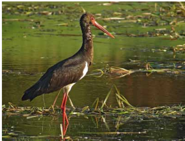
■ Cigogne noire ( Ciconia nigra ), un échassier dont la population nicheuse et la population de passage sont respectivement classées "En danger" et "Vulnérable" en métropole

pendant près d'un siècle, le Vautour moine niche à nouveau dans les Grands Causses grâce au succès de son programme de réintroduction. Et certaines espèces, comme le Phragmite aquatique et le Balbuzard pêcheur, font actuellement l'objet d'un plan national d'action pour améliorer leur situation.