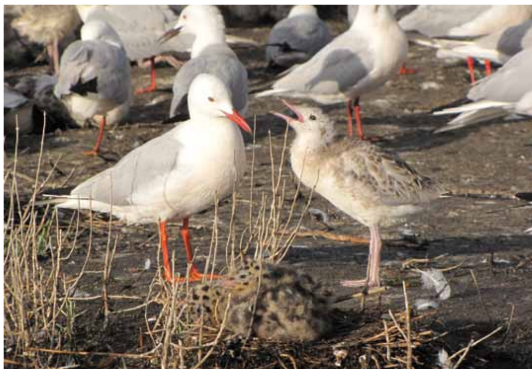
■ Goéland railleur ( Chroicocephalus genei ), une espèce marine classée "En danger" en tant que nicheur