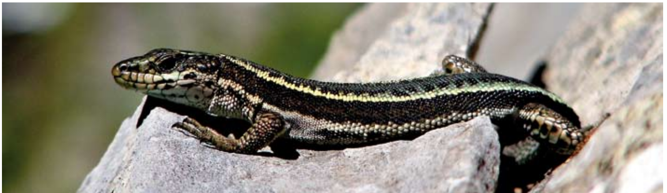
■ Le Lézard du Val d'Aran ( Iberolacerta aranica ), une espèce classée "En danger"

Répartition des 37 espèces de reptiles et des 34 espèces d'amphibiens évaluées en fonction des différentes catégories de la Liste rouge (nombre d'espèces entre parenthèses)