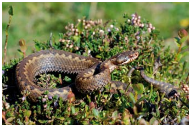
■ La Vipère de Séoane ( Vipera seoanei ), une espèce "Quasi menacée"

L'assèchement des zones humides et le comblement des mares représentent une menace pour la survie de la Grenouille des champs (En danger critique) et du Pélobate brun (En danger). La pollution des milieux aquatiques a également contribué à la raréfaction des espèces dépendantes de ces habitats naturels.